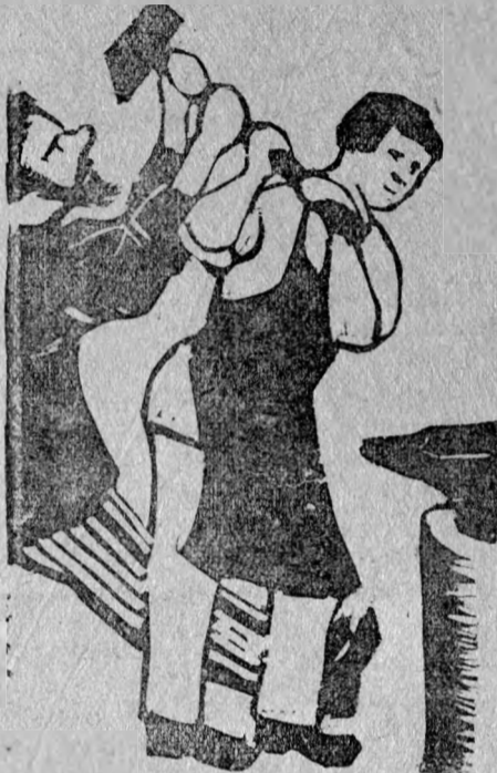
Стой, расценки собьешь!..